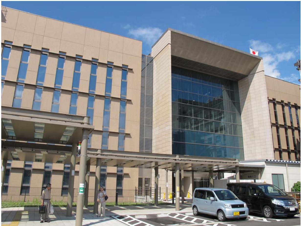
神戶大學附屬醫院